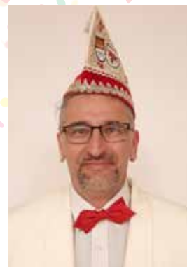
Senatspräsident Milorad Pavlovic