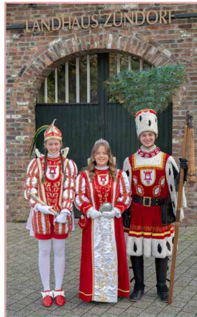
Prinz Ella I.